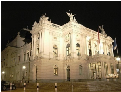
Ticket Opernhaus Zürich